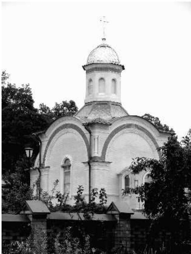
Часовня над могилами трех убиенных монахов

Потом нашу группу повели в скит. В сам скит входить мирянам не разрешается, чтобы не нарушать молитвенного покоя монахов, да и услышав такое замечание, чувствуешь неловкость: мы мешаем, и хочется быстро уйти. Рядом со скитом колодец, где можно набрать святой воды, но сначала надо покрутить ручку, чтобы насос стал качать воду.