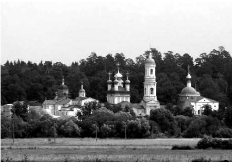
Свято-Введенская Козельская Оптиная пустынь

поколений здесь прошло, а Оптиная все притягивает и притягивает людей, зовет к себе. На старом монастырском кладбище надгробие над могилой сестры Л.Н. Толстого, какого-то статского советника «служившего верой и правдой Отечеству», надгробные камни с могил