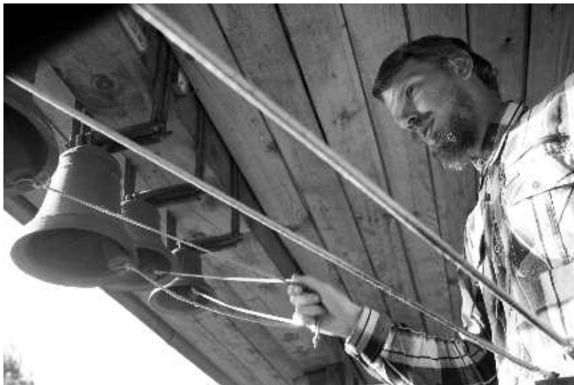
На колокольне храма святителя Николая у Соломенной сторожки

Прп. Павлин Милостивый был епископом города Мовы близ провинции Кампана, Италия, поэтому в греческой традиции родилось выражение «в кампана клепать».