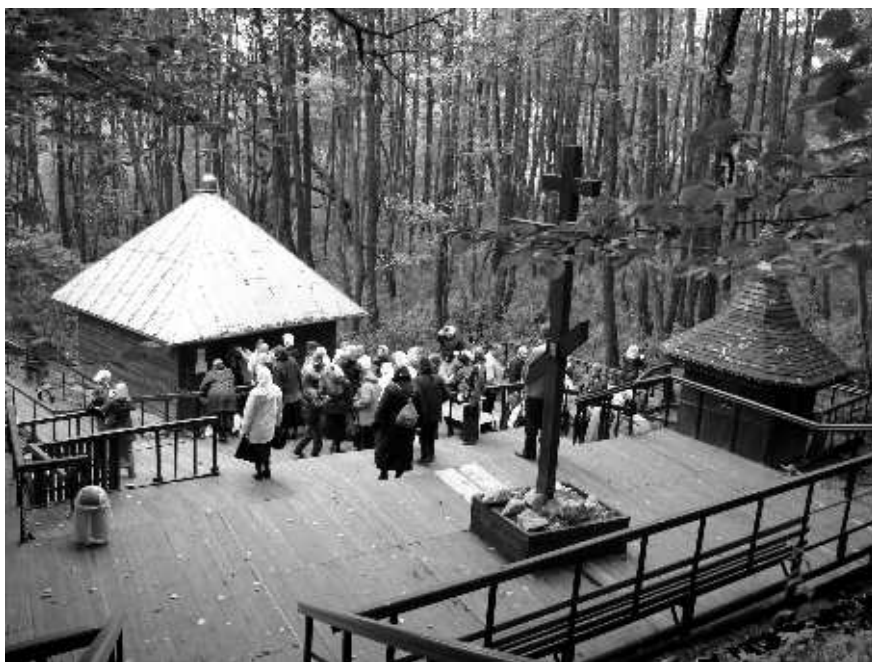
Источник преподобных Оптиных старцев в Шамордине

гостиницы. Экскурсовод рассказывал о планах на следующий день, а я вспоминала торжественность и глубину монастырской всенощной службы.