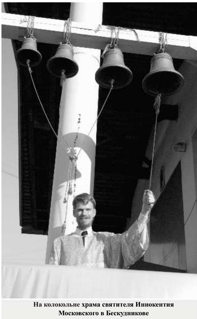
На колокольне храма святителя Иннокентия Московского в Бескудникове

– Колокольный звон возник в IV–V веках, во времена первого гонения на христиан. Преподобный Паулин Милостивый размышлял, как помочь христианам, и уснул. Во сне ему явились Ангелы, в руках у них было семь полевых цветочков, колокольчиков. И когда он проснулся, то приказал отлить такие колокола и был поражен, что звук этих колоколов был точь-в-точь таким же, как и звук полевых колокольчиков.