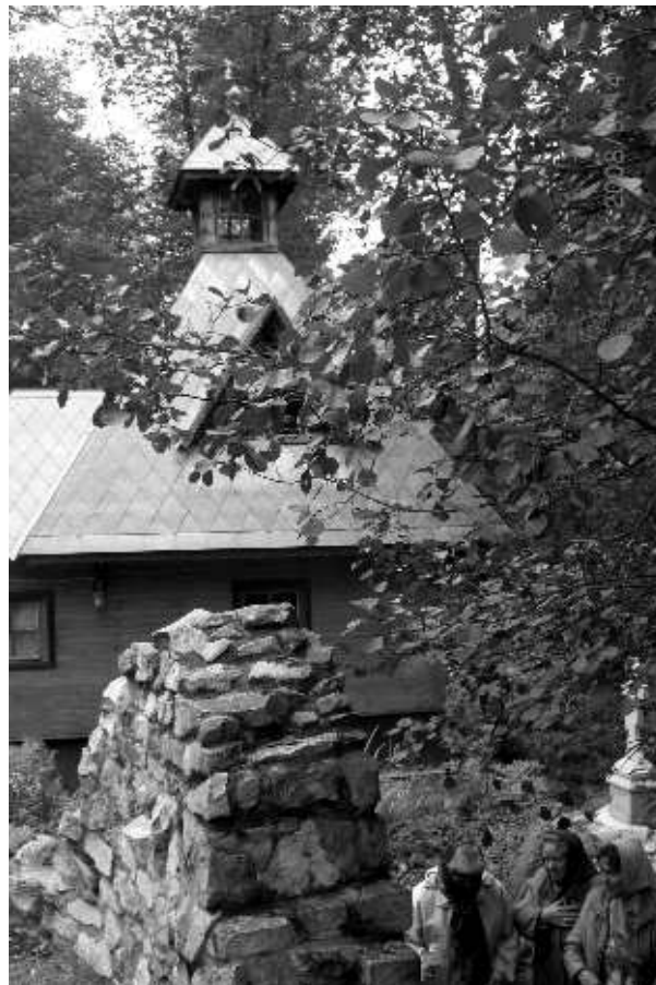
Источник преподобного Тихона Калужского

Хочу также рассказать о чуде, которое произошло сразу по приезде из Оптиной. Многие, наверное, знают, что я несу послушание директора Воскресной школы для детей; так вот, были в школе проблемы с нехваткой педагогов, вешали объявление, что требуются нам люди, но никто не приходил, а времени до начала занятий в школе оставалось мало. В Оптиной пустыни, молясь перед ракой прп. Амвросия, я попросила батюшку помочь Воскресной школе. В понедельник утром в Воскресную школу пришла девушка устраиваться преподавателем. Спасибо, отец Амвросий за заботу и за скорую помощь нам! Моли Бога о нас и детках наших!