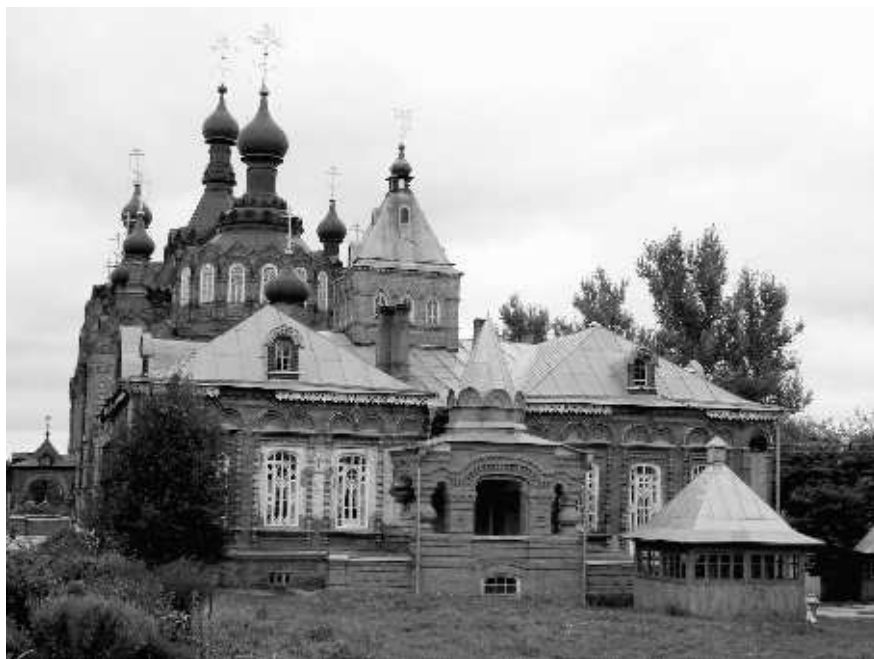
Казанская Амвросиевская женская пустынь в Шамордине

Слава Богу! Службу отстояла, спина и ноги на месте, не отвалились, наоборот, ощущался подъем сил и радость. С таким чувством ехала до самой